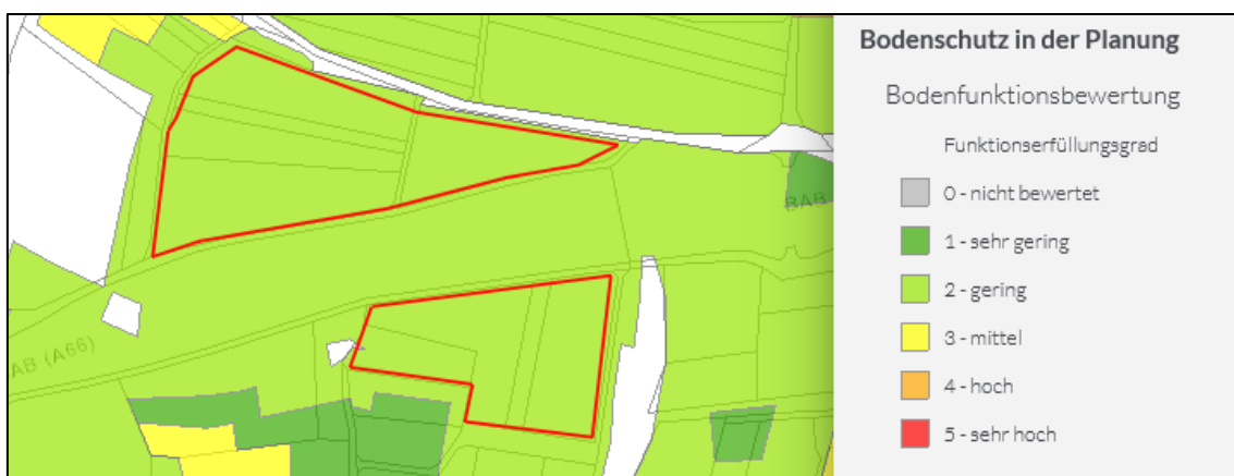
Abb.: Bodenfunktionsbewertung BodenViewer Hessen

Die Planfläche von ca. 4,8 ha Größe ist flächig mit „Stufe 2 – gering“ für den Funktionserfüllungsgrad bewertet. Die folgende Abbildung stellt den Ausschnitt mit Darstellung der Bewertung aus dem BodenViewer Hessen dar.